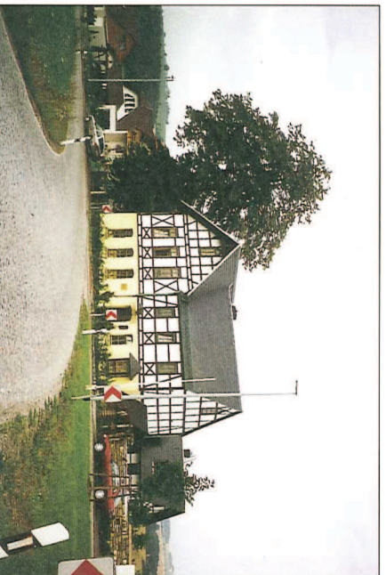
Abb. 2: Blick auf das rekonstruierte Gebäude

Mit der Erweiterung und dem Ausbau der ortsansässigen Traditionswerkstatt „Drechslerei/Tischlerei“ Zickra werden in der Region nicht nur neue Arbeits- und Ausbildungsplätze geschaffen. Das traditionelle Handwerk des Drechselns wird erfolgreich an die jüngere Generation weitervermittelt. Von besonderer Bedeutung ist dabei die Verwertung des nachwachsenden Rohstoffes Holz aus der eigenen Region.