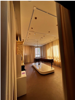
Ausstellungsräume Museum „betont“