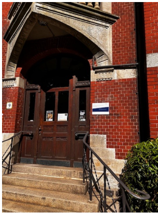
Eingangsbereich historisches Rathaus