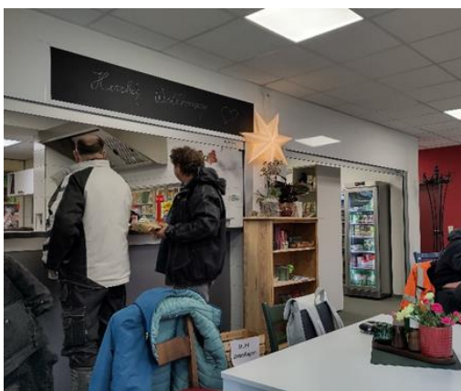
Abbildung 3: Bernitter Dorfladen Mittagsangebot

Telefon: 038464 225373; E-Mail: kontakt@bernitterdorfladen.de ; www.bernitterdorfladen.de