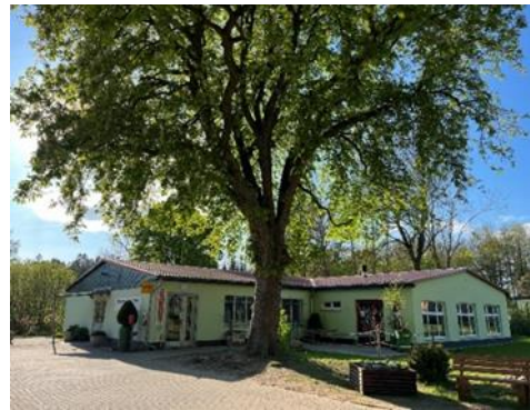
Abbildung 2: Die neue Dorfmitte und der Dorfladen

Als der alte Dorfladen aus Altersgründen schloss, wollten sich die Menschen in Bernitt nicht damit abfinden, dass die nächste Einkaufsmöglichkeit zehn Kilometer entfernt liegt. Es sollte ein neues Dorfzentrum entstehen, in dem man Lebensmittel einkaufen, die Post erledigen und sich bei einer Tasse Kaffee sowie einem Stück Kuchen untereinander austauschen kann. Die Dorfbewohner wünschten sich einen solchen zentralen Anlaufpunkt.