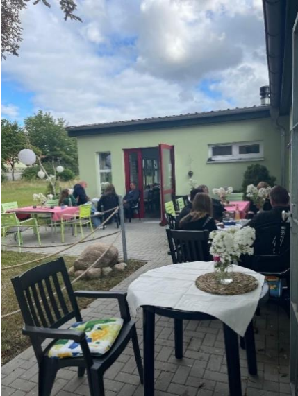
Abbildung 5: Bernitter Dorfladen Anbau mit Außenanlage