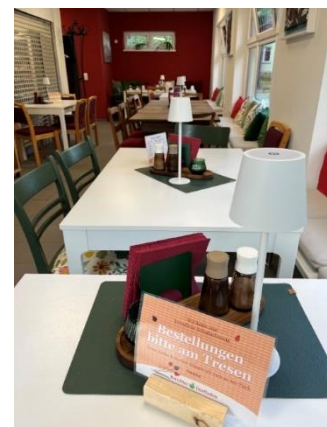
Abbildung 4: Bernitter Dorfladen Gastraumvergrößerung nach Anbau