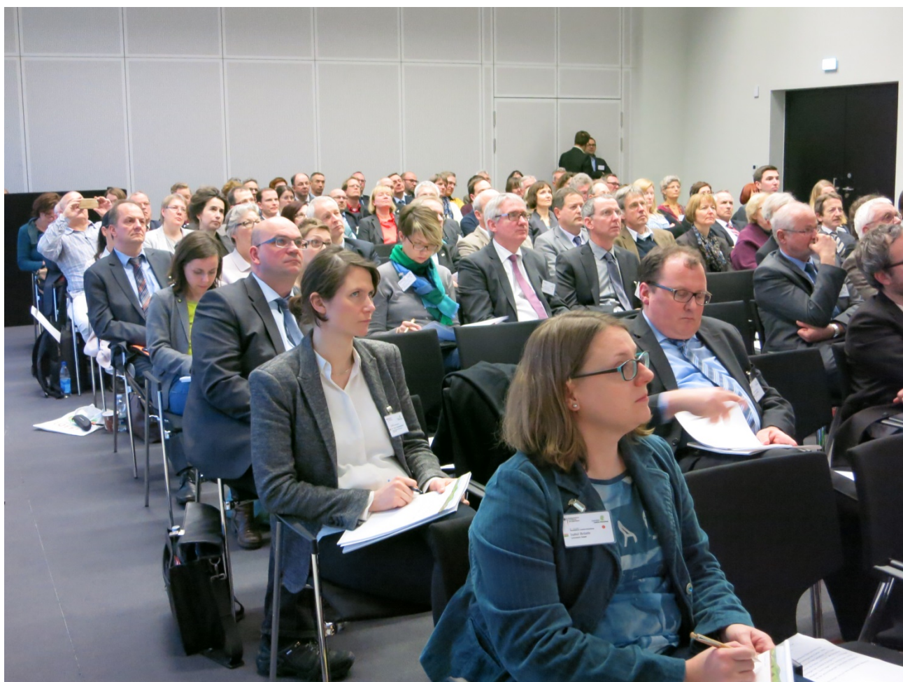
Die Besucherinnen und Besucher der 9. Zukunftsforums interessierten sich sehr für die Begleitveranstaltungen der ArgeLandentwicklung