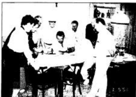
Abb. 3: Häufiger Informationsaustausch ist unerlässlich, aktive Arbeit der Teilnehmergeinschaft

Nur in enger Zusammenarbeit aller direkt und indirekt Betroffenen kann die Fülle von Problemen gelöst werden.