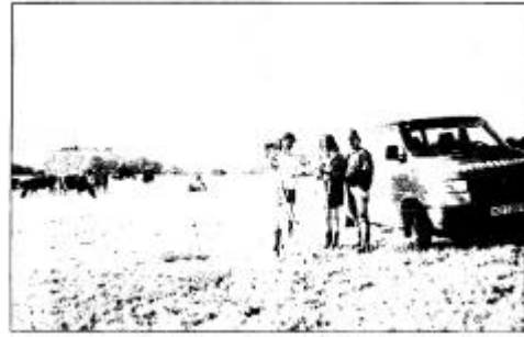
Abb. 5: Umfangreiche Vermessungsarbeiten waren notwendig