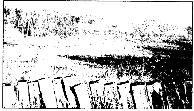
Abb. 1 und 2: Eine harmonische Kulturlandschaft...