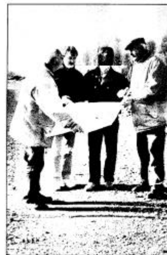
Abb. 6: Planberatung vor Ort

Was durch erste Gespräche zwischen Eigentümern und dem ALN Oberlungwitz über Möglichkeiten der Neuordnung des ländlichen Grundbesitzes begann, entwickelte sich bald zu einem vom Gedanken des Natur- und Landschaftsschutzes getragenen Verfahren. Langfristig sollten die wertvollen Lebensräume im Naturschutzgebiet erhalten bleiben. Gleichzeitig stehen die rechtliche Sicherung sowie Schaffung wirtschaftlich zweckmäßig geformter und durch Wege erschlossener Besitzstände, die einen möglichst zusammenhängenden Grundbesitz ergeben sollen, bei diesem Verfahren neben den anderen aufgezeigten Kriterien im Mittelpunkt.