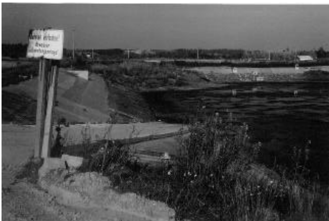
Gülleteich im Gebiet Finkenmühle