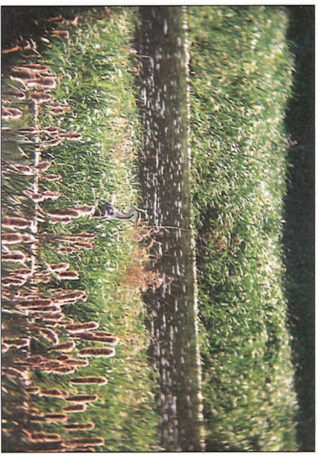
Abb. 6: Feucht- und Nasswiesenbereich im Dankmarshäuser Rhäden

Die Umsetzung der aufgeführten Schutzziele, insbesondere die geplanten Erweiterungen der Feucht- und Nasswiesenbereiche auf ackerbaulich genutzten Flächen, verursachen Landnutzungskonflikte zwischen Naturschutz und Landwirtschaft.