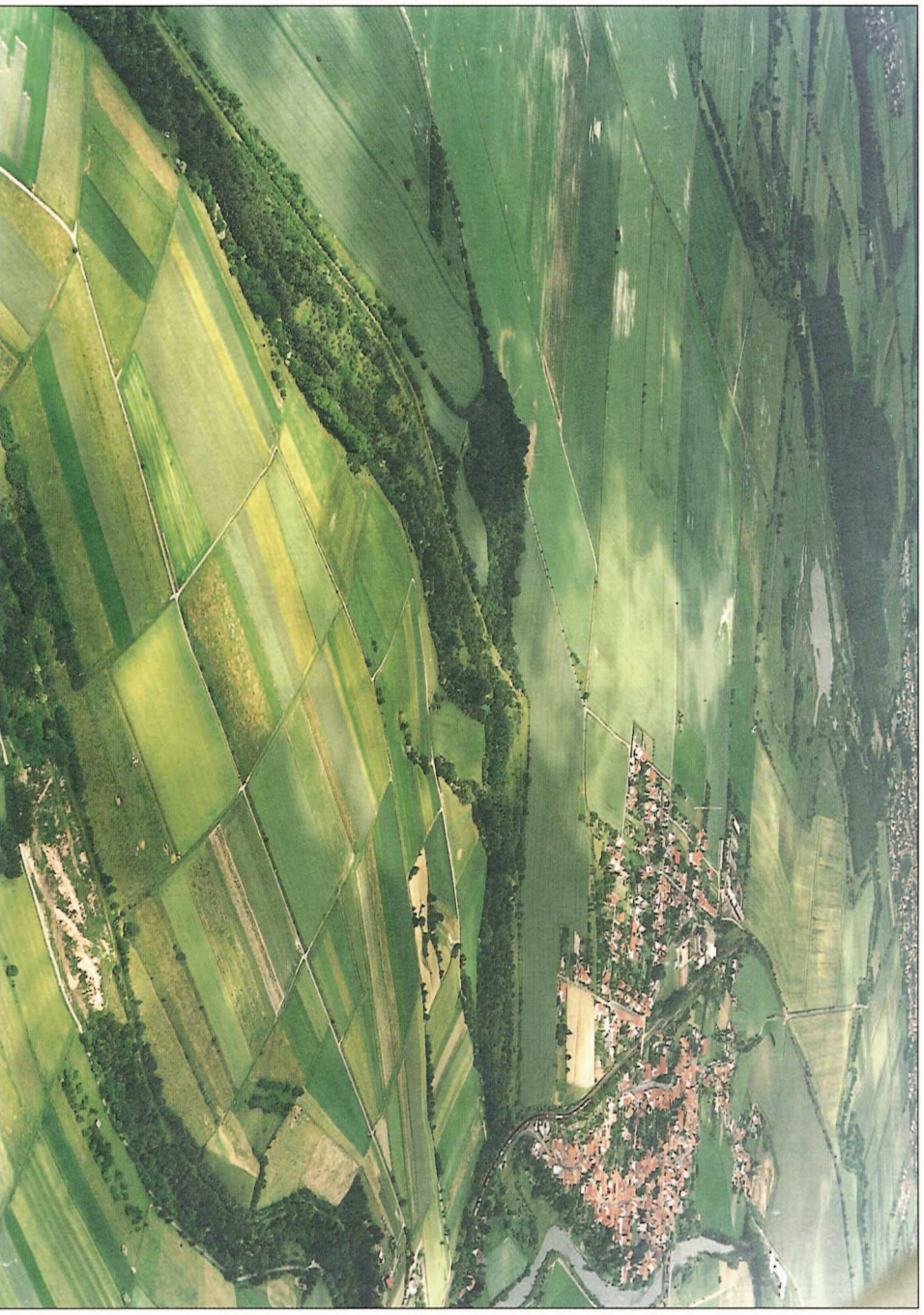
Abb. 1: Luftbild des Flurbereinigungsgebietes Dankmarshäuser Rhäden

Heute trägt auch das im Januar 1999 nach § 86 FlurbG angeordnete vereinfachte Flurbereinigungsverfahren diesen Namen. Es wurde auf gemeinsamer Initiative der Thüringer Naturschutz- und Flurneuordnungsverwaltung und der Gemeinde Dankmarshausen eingeleitet.