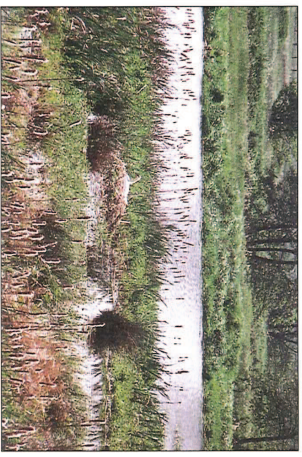
Abb. 7: Landnutzungskonflikte zwischen Landwirtschaft und Naturschutz gilt es zu lösen