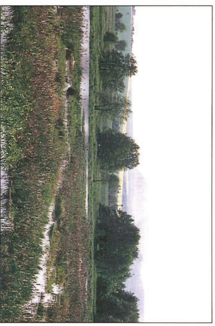
Abb. 4: Dankmarshäuser Rhäden – ein Refugium bedrohter Tier- und Pflanzenarten

Das Flurbereinigungsareal selbst ist Teil einer Talsohle (Rhädensenke), eine im wesentlichen salztektonisch entstandene Auslaugungssenke im Ausstrich des Unteren Buntsandsteins. Daraus haben sich überwiegend Gleyeböden entwickelt. Diese sind für den Ackerbau kaum, für die Grünlandbewirtschaftung aufgrund des oberflächennahen Grundwasserspiegels nur bedingt geeignet. Trotz der aus Sicht der agrarischen Bodennutzung gegebenen, ungünstigen Ertragsbedingungen werden gegenwärtig im NSG ca. 100 ha und außerhalb des NSG ca. 50 ha landwirtschaftlich genutzt, überwiegend sogar im Ackerbau. Im Rahmen vor ca. 20 Jahren durchgeführter umfangreicher Meliorationsmaßnahmen wurden hierzu die Voraussetzungen geschaffen. Es liegen großflächige Bewirtschaftungseinheiten mit einer durchschnittlichen Schlaglänge von 0,6 km vor.