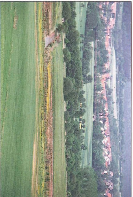
Abb. 2: NSG Dankmarshäuser Rhäden

Im Norden grenzt direkt das NSG „Obersuhler Rhäden“ (Hessen) mit einer Größe von ca. 130 ha an. Beide NSG bilden ein zusammenhängendes Reservat bedrohter Tier- und Pflanzenarten. (Abb. 2 bis 4)