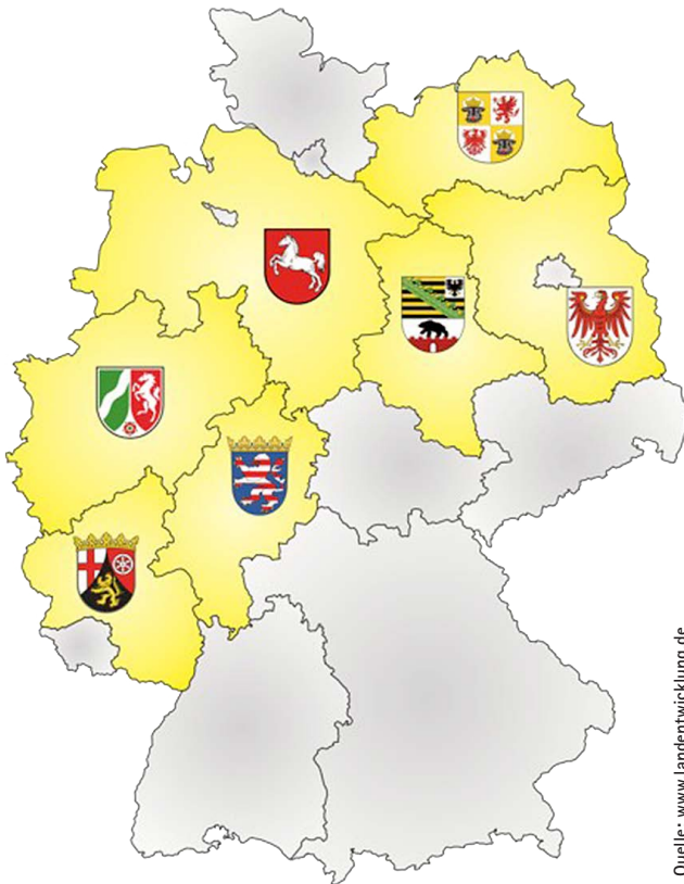
Abb. 4: Mitglieder der Implementierungsgemeinschaft

waresysteme in den Flurbereinigungsbehörden hatte die ArgeLandentwicklung im Jahr 2000 begonnen, basierend auf dem AAA-Modell der Katasterverwaltung ein Datenmodell für ein integriertes Fachinformationssystem zur Bearbeitung von Bodenordnungsverfahren nach dem Flurbereinigungs- und dem Landwirtschaftsanpassungsgesetz zu entwickeln.