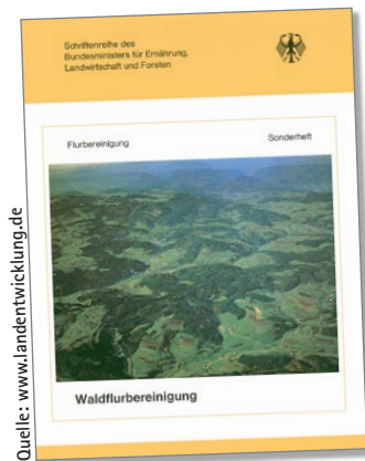
Abb. 2: Waldflurbereinigung – Deckblatt des Sonderheftes 21 der Schriftenreihe für Flurbereinigung des BML

Die Einleitung und Durchführung von Waldflurbereinigungen mit ihren Besonderheiten der Wertermittlung des Holzbestandes und der Waldböden sowie technische Hilfsmittel wie z.B. Luftbilder und Datenverarbeitung werden beschrieben.