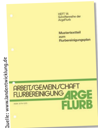
Abb. 1: Mustertextteil zum Flurbereinigungsplan – Deckblatt des Heftes 14 der Schriftenreihe der ArgeFlurb