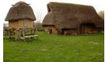
Freilichtanlage des Landschaftsverbands Rheinland

Ein weiteres bedeutendes Zeugnis europäischer Geschichte ist die Kommende in Siersdorf, deren heutige Form 1578 im Renaissancestil erbaut wurde. Bis zur Zeit Napoleons hat die Kommende dem Deutschen Ritterorden gehört. Danach ist sie in Privatbesitz übergegangen, im 2. Weltkrieg teilweise zerstört worden und seither verfallen. Ein Förderverein bemüht sich heute um den Wiederaufbau der Kommende.