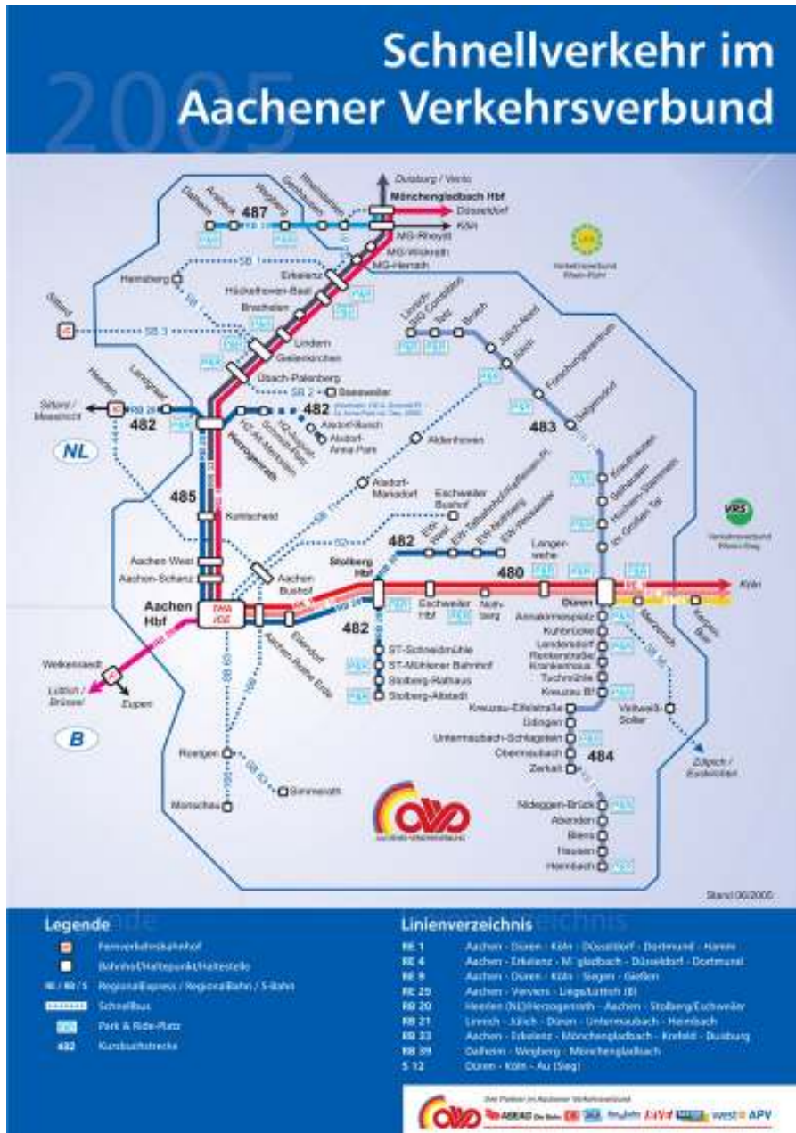
Abb. 1 Netzplan im regionalen Verkehrsverbund