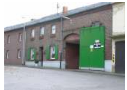
Verkauf landwirtschaftlicher Produkte direkt ab Hof

Die Region verfügt über eine gute Markt- und Absatzstruktur der landwirtschaftlichen Produkte. Veränderungen sind durch die Reform der Zuckermarktordnung zu erwarten. Auch die Weiterentwicklung der Tagebaue Inden und Hambach gefährdet die wirtschaftlichen Perspektiven besonders in Inden und