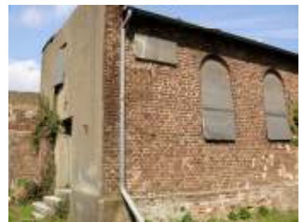
Jüdische Synagoge Rödingen