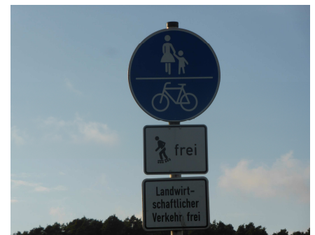
Multifunktionalität heutiger Wege im ländlichen Raum

Automatisierte Berechnungen zu Verkehrsbelastungen von ländlichen Wegen stellen eine Planungsgrundlage für das Kernwegenetz da, ersetzen aber nicht die aktive Beteiligung der Bürger bei der Konzepterstellung des Kernwegenetzes.